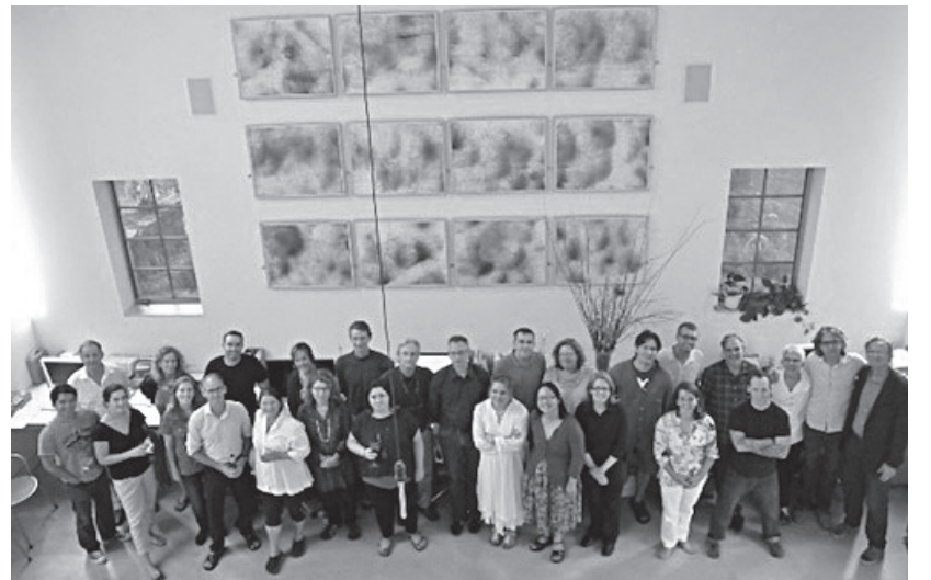
Winterhouse Studio, 2011.